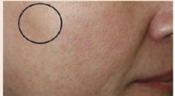
Nach 7 Sitzungen