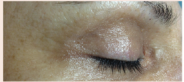
Nach 1 Sitzung