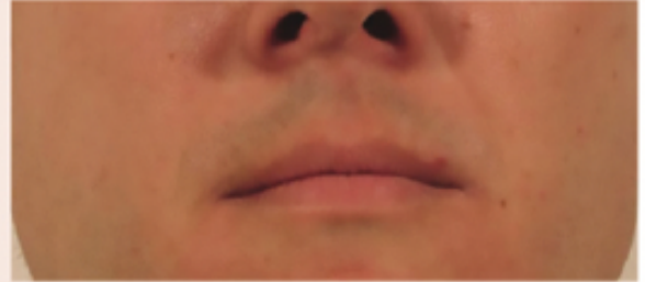
Nach 7 Sitzungen